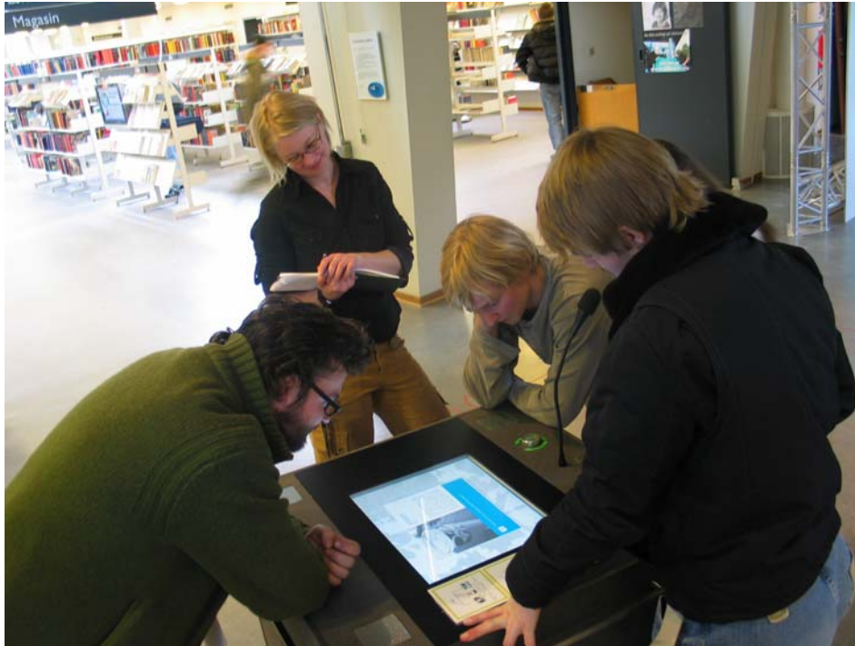
Fokusgruppe: Informations- & Medievidenskab

Periode for borgerinddragelse: marts, 2006