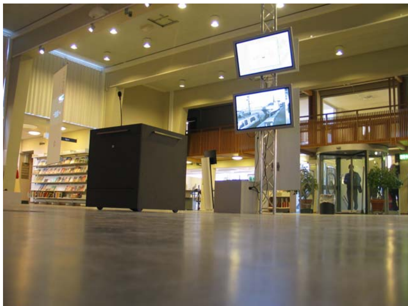
Opstilling på Hovedbiblioteket

Generelt har der været stor interesse for projektets inddragende, teknologiske og innovative dimension, hvilket i sidste ende vurderes at kunne smitte positivt af på omverdenens opfattelse af MMH som en nytænkende og inddragende institution