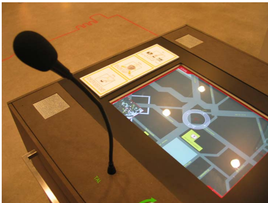
Billede af det interaktive bord.

Generelt mener flere grupper, at MMH skal basere sig på løse projektsamarbejder frem for faste samarbejdspartnere, for at sikre en tilstrækkelig dynamisk udvikling i huset og de aktiviteter, der udføres i samarbejde med eksterne partnere.