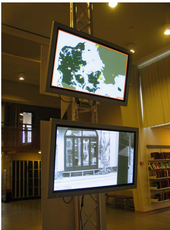
Storskærme på Hovedbiblioteket med kort samt inspirationsbilleder.